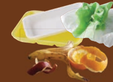
Articles d'hygiène, polystyrène, restes alimentaires