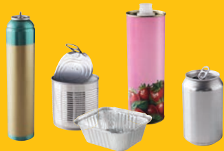
Emballages en métal