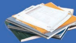
Cahiers, blocs-notes, impression