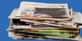
Journaux, catalogues, prospectus