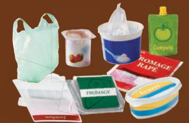
Sacs, sachets, barquettes, films, tubes, pots, gobelets, boîtes en plastique