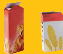
Emballages en carton

JE DÉPOSE DANS LA BORNE « EMBALLAGES EN VERRE À RECYCLER »