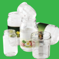
Pots et bocaux