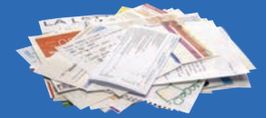
Courriers, enveloppes, livres

TOUS LES PAPIERS SE TRIENT ET SE RECYCLENT