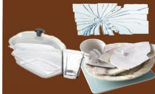
Plats en vitrocéramique, vaisselle, porcelaine, vitres cassées

JE JETTE DANS LE SAC D'ORDURES MÉNAGÈRES